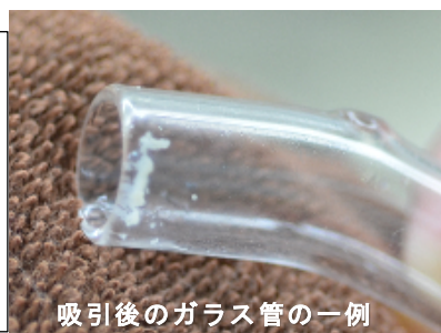
吸引後のガラス管の一例

※炎症ニキビが広範囲にある方や、肌質によってはお受け頂けない場合があります。ご了承ください。